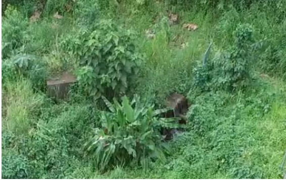
Trampas de grasas.